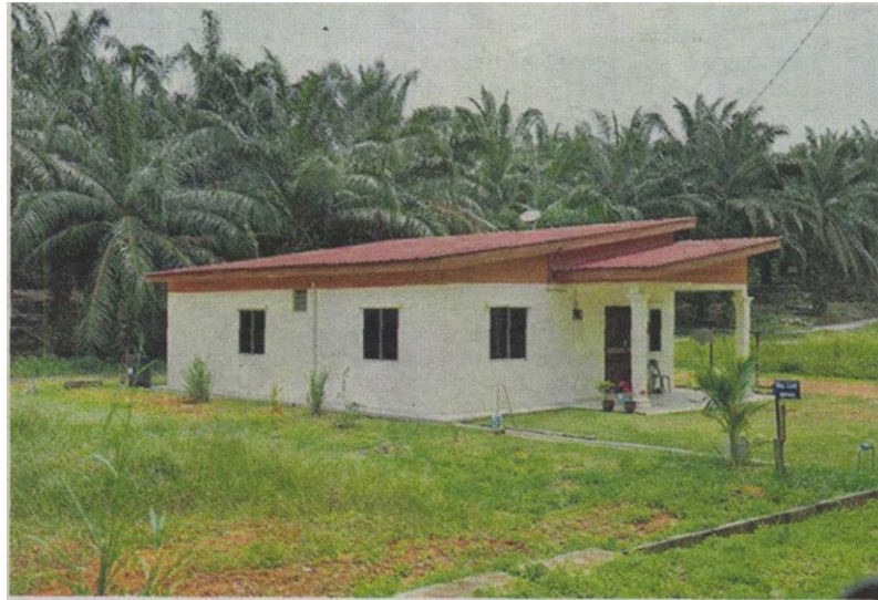
RUMAH Mesra Rakyat yang dibangunkan SPNB akan menggunakan produk-produk dibekalkan oleh SESB. – Gambar hiasan