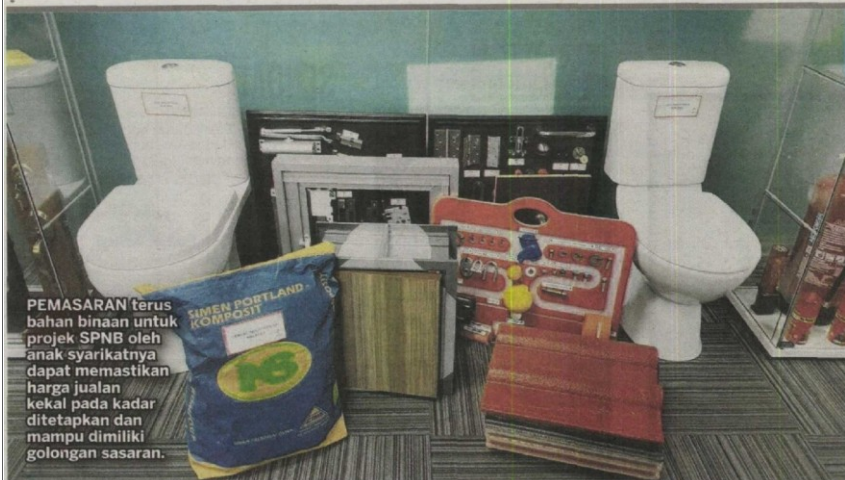
PEMASARAN terus bahan binaan untuk projek SPNB oleh anak syarikatnya dapat memastikan harga jualan kekal pada kadar ditetapkan dan mampu dimiliki golongan sasaran.