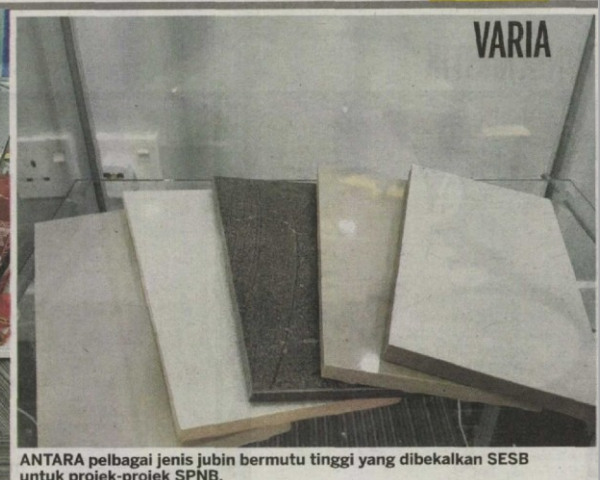
ANTARA pelbagai jenis jubin bermutu tinggi yang dibekalkan SESB untuk projek-projek SPNB.