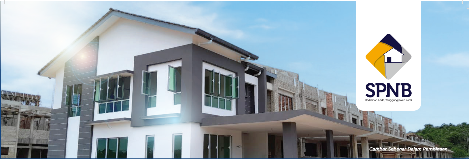
Gambar Sebenar Dalam Pembinaan