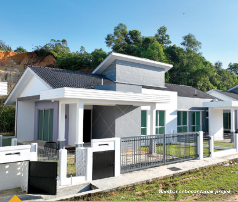
Gambar sebenar tapak projek